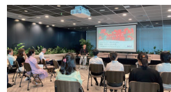
「カラコエの花」上映会 & トークセッション実施