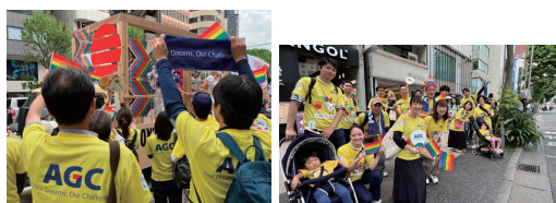
(3年連続参加) 東京レインボープライドパレード 沿道応援参加